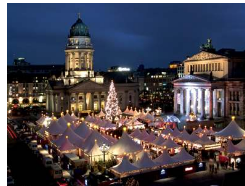
Julemarked på Gendarmenmarkt

Morgenmad på hotel. På egen hånd i Berlin. Besøg et eller flere af byens spændende seværdigheder. Besøg f.eks. KaDeWe, Berlins mest luksuriøse og kæmpestore stormagasin, som har en helt overdådig juleudsmykning. Gå også en tur ned ad den berømte Kurfürstendamm. Aftensmad i eget regi.