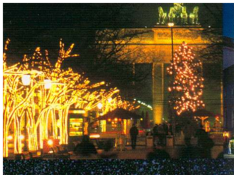
Smukt julepyntet allé op til Brandenburger

Ta' med Lonni Rejser på 4 dages julerejse til Tysklands spændende hovedstad Berlin. Tyskland har en årelang tradition for julemarkeder, og metropolen Berlin med ca. 5 mio. indbyggere har selvfølgelig en hel masse. Berlin har desuden mange historie- og kultur minder og bygningsværker som f.eks. Brandenburger Tor, Rigsdagen, Rådhuset i Schöneberg og Gedächtniskirche m.m.. Berlin er også en spændende shoppingby - med Tysklands største varehus "KaDeWe" på Kurfürstendamm - så her er chancen for at finde årets julegave.