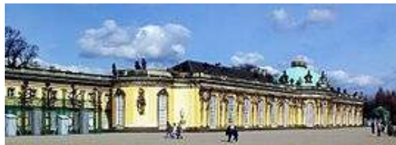
Sanssouci; tidligere sommerplads for Frederik den Store.

Morgenmad på hotel. Dansk-talende guide kommer kl. 9.30 og vi besøger den gamle garnisonsby Potsdam (120.000 indb.) med det yndefulde Rokokoslot Sanssouci, som undslap bombardementerne under 2. Verdenskrig. Aftensmad på den berømte restaurant Der Alte Fritz, beliggende ved Alexanderplatz.