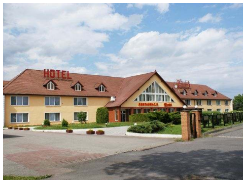
Transit hotel i Zary

Ta' med Lonni Rejser på 8 dages rejse til Polen. Vi bor i Krakow, den gamle storby i det sydlige Polen, tæt på landets grænse til Slovakiet. Byen har ca. 756.000 indbyggere og ligger ved floden Wisla. Det er Polens næststørste by. Tidligere var Krakow landets hovedstad og den var kongeby.